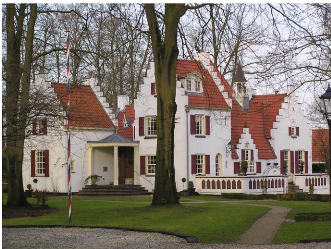
De Zandhof

Wie net een rondje Elper Westerveld achter de rug heeft, begrijpt iets van het optimisme van de Elper 'kasteelheer'. We begonnen de heide om te spitten. We groeven sloten, maar we gooiden ze ook weer dicht. We plantten bos, maar we kaptten het. We maakten van akkerland weer heideveld. En Drenthe bleef gewoon Drenthe!