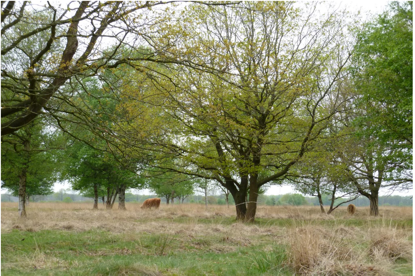
Elper Westerveld

Beschouw het Elper Westerveld als een doorsnee Drents landschap. Aan de rand van het dorp Elp ligt een bosje met grillige eiken, dan komt u via een dicht jeneverbesstruweel op een open geaccidenteerd heideveld, dat overgaat in natte heide en eindigt in de groenlanden van de Westerbroeken. Duidelijk een aflopende zaak dus. Onderweg zult u erachter komen dat natuur soms lang niet zo natuurlijk is als zij er op het eerste gezicht uitziet. En dat de uitdrukking 'een doorsnee Drents landschap' beslist een eretitel is!