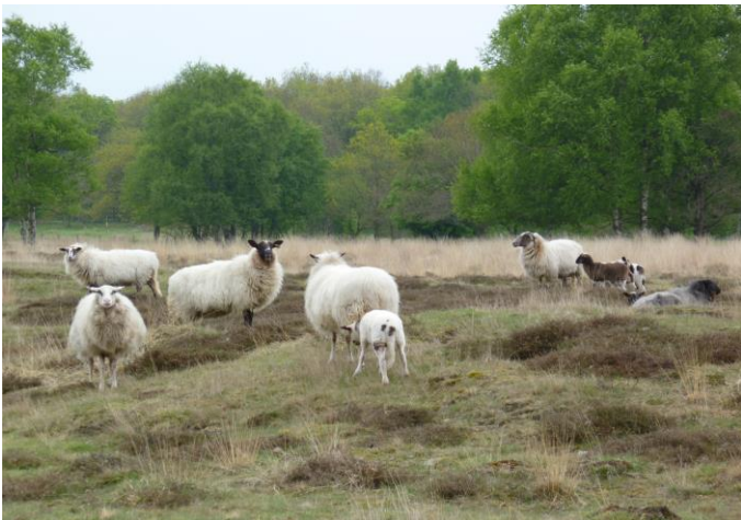
Schapen op het Elper Westerveld

Het Drentse Landschap heeft veel in het Westerveld geïnvesteerd, omdat het om een zeer karakteristiek Drents landschap gaat. Het begint met een strubbenbosje op een voormalige zandverstuiving aan de rand van het dorp en loopt via dicht jeneverbesstruweel, een vochtig heideveld en geaccidenteerde droge heide door tot aan de kletsnatte groenlanden van de Westerbroeken.