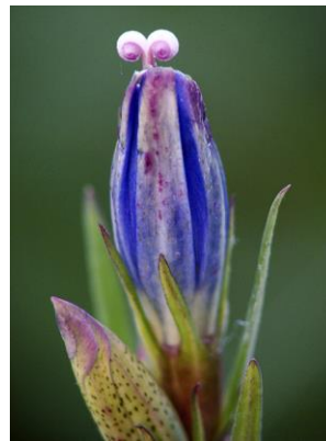
Klokjesgentiaan in knop

Een groot deel van de neerslag stroomde westwaarts het Westerveld af, maar ingrepen in de waterhuishouding maakten daar in de jaren zestig van de vorige eeuw grotendeels een eind aan. Diepe van noord naar zuid lopende sloten zorgden voor een compleet andere waterhuishouding en het Elper Westerveld verdroogde in snel tempo. Al deze ingrepen worden waar het mogelijk is weer ongedaan gemaakt. Zo hoopt men dat het verschil in vegetatie tussen de hoger en lager gelegen delen van het veld weer zal toenemen. De massale aanwezigheid aan de westkant van het veld van de vochtminnende klokjesgentiaan met zijn prachtige blauwe bloemen in de zomer, bewijst dat het met het Westerveld weer de goede kant opgaat.